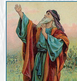
Prophet Isaiah; illustration from a Bible card published by the Providence Lithograph Company (c. 1904)

Dieser Abschnitt wurde 700 Jahre bevor Christus geboren wurde von dem Propheten Jesaja geschrieben. Man kann deutlich erkennen, dass es um Jesus und die Tatsache geht, dass Er für unsere Sünden sterben würde. Aber es geht auch darum, dass Er unsere Krankheiten und Schmerzen tragen würde.